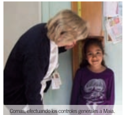
Comas, efectuando los controles generales a Maia.